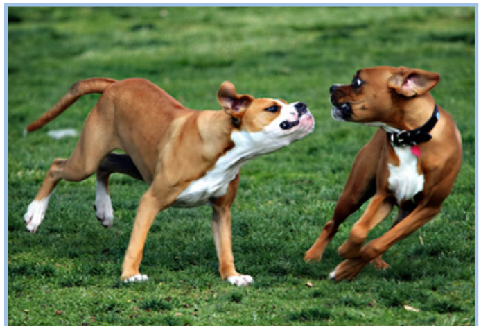
Afbeelding 1: Agressief gedrag richting andere honden

Ter illustratie even een voorbeeld: Een eigenaar van een American Stafford gaf aan dat ze nooit naar het honden-uitlaatveld aan de overkant van de straat kon gaan omdat haar hond alle honden aanvalt. De eigenaar gaf aan dat haar hond heel lief is maar door een eerder incident had ze een aantekening bij de politie. Een tweede aantekening zou inbeslagname betekenen en de eigenaar was daar erg bang voor. Tijdens ons gesprek gaf de hond aan dat hij alleen maar voldeed aan de verwachtingen; hij reageerde volgens het beeld dat hij voorgeschoteld kreeg. Na mijn gesprek met de hond en de terugkoppeling daarvan aan de eigenaar, was de eigenaar zich